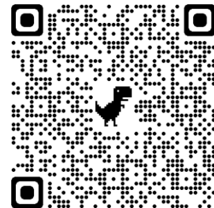
特設ページ QR コード